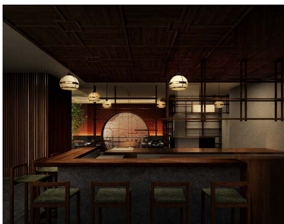
宿泊者専用ラウンジ兼バー イメージ画像