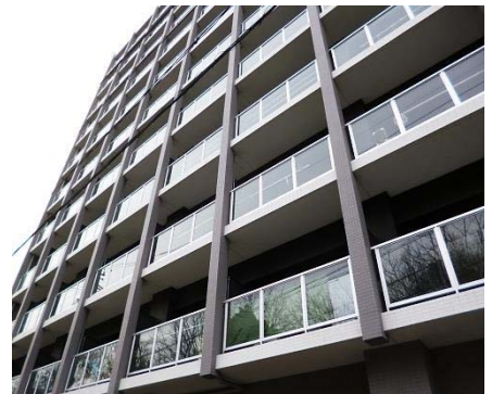
プレミネンテパーク藤が丘