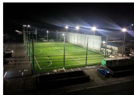
フットサルコート完成イメージ